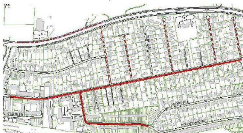
Nye spildevandsledninger i Aldershvilevej-området

Foreningen har i årevis påvist, at kvarterer i Bagsværd er særlig hårdt ramt af oversvømmelser og andre gener. Særligt Bondehavevej/Aldershvilevej-kvarteret og kvarteret omkring Skråvej har været hårdt ramt. Vi har fremsendt klager fra medlemmer til kommunen, og vi har ved høringer om spildevandsplanlægning anmodet om at problemet bliver løst. Trods dette prioriterede "Spildevandsplan 2006" ikke Bagsværd-området. Planen fastlagde at hovedspildevandsledningen på Bindeledet først ville blive renoveret i 2015!