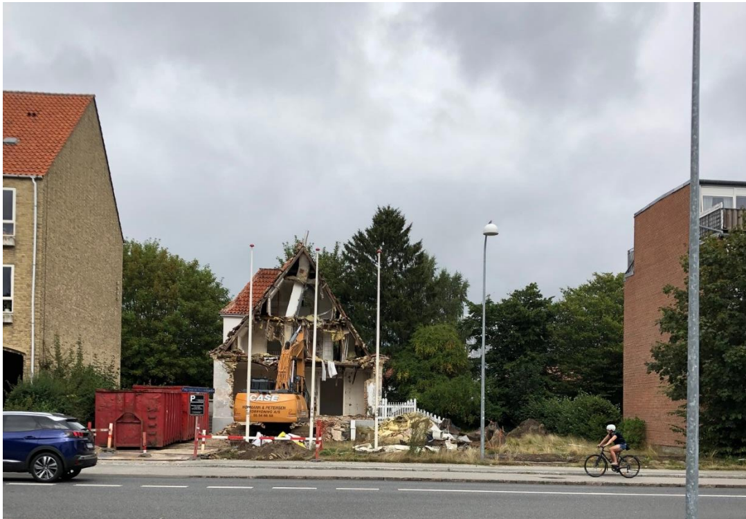
Nedrivningen fra sommer 2022 og nu en tom grund